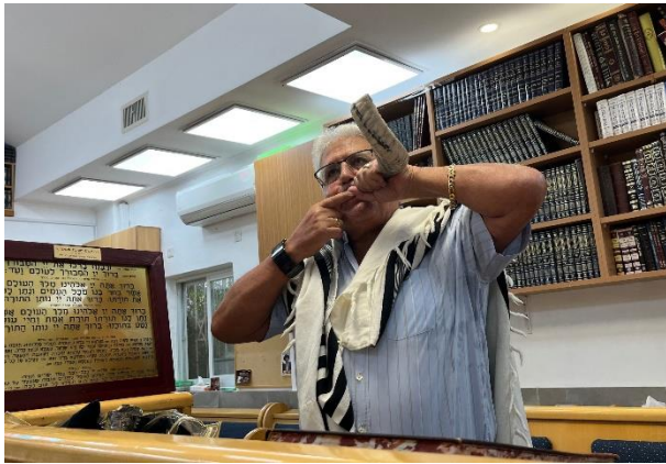
Tijdens Rosj Hasjana wordt veel op de ramshoorn geblazen.

Rosj Hasjana, Joods Nieuwjaar, is een van de Bijbelse feesten waarover je kunt lezen in Leviticus 23. Rosj Hasjana wordt ook wel het 'feest van het bazuingeschal' genoemd. Beter nog: het 'feest van het ramshoorngeschal'. Tijdens het feest wordt in de synagoge namelijk twee dagen achter elkaar tenminste 100 keer op een 'sjofar', een ramshoorn geblazen.