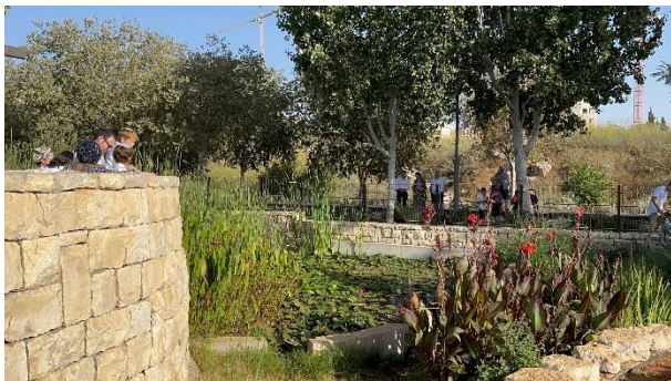
Joden verrichten 'tasjliech' bij een vijver in Jeruzalem.

Het blazen op de ramshoorn luidt de tien dagen van 'tesjoeva' in, tien dagen van bekering, bezinning en verlangen naar de vergeving van de Heere. Het zijn de tien dagen tussen Rosj Hasjana en het belangrijkste Joodse feest: Jom Kipoer (Grote Verzoendag).