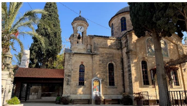
In Kfar Kana staan enkele prachtige kerken.

Als het gaat om Kana zijn er in Galilea twee plaatsen waarvoor alle kenmerken gelden. Dat geldt allereerst voor het dorpje Kfar Kana. 'Kfar' betekent in het Arabisch dorp.