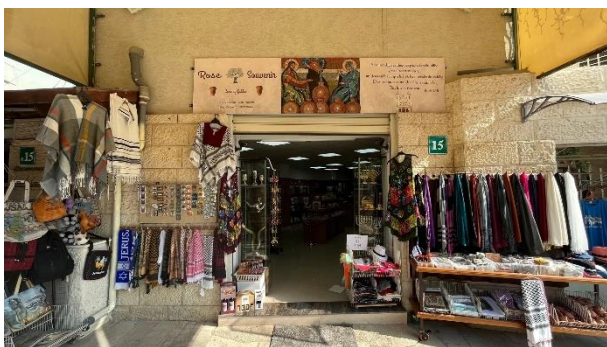
Toeristenwinkel in Kfar Kana.

Als je de kerken bekijkt, dan kan het je niet ontgaan dat de mensen hier ervan overtuigd zijn dat Kfar Kana het Bijbelse Kana is, de plaats waar de Heere Jezus Zijn eerste openbare wonder verrichtte.