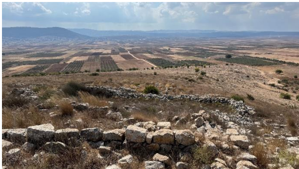
Restanten van Khirbet Kana.

Ook van Khirbet Kana wordt wel gezegd dat het het Bijbelse Kana was. Het woord 'khirbet' betekent in het Arabisch 'ruïne'. Khirbet Kana betekent dus: 'de ruïne van Kana'. Khirbet Kana ligt hemelsbreed zo'n tien kilometer af van Kfar Kana.