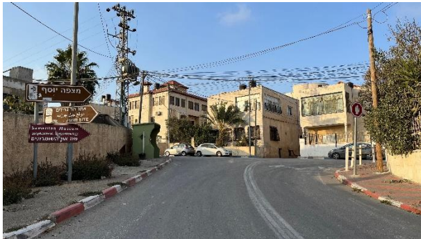
Straatbeeld in Kiryat Luza.

Samaritanen. Aan de voet van de Gerizim ligt Sichem, het huidige Nablus. Ooit woonden ook daar erg veel Samaritanen.