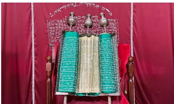
Een Samaritaanse Thorarol.

De Samaritanen wonen al heel lang in de regio. Dat begon ongeveer 2700 jaar geleden. In het jaar 722 voor Christus werden de Joodse inwoners van het