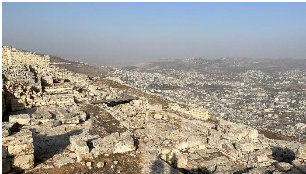
Restanten van de tempel van de Samaritanen op de Gerizim.

De Samaritanen hebben op de Gerizim in de vijfde eeuw voor Christus ook een eigen tempel gebouwd. Van die tempel zijn slechts restanten over. De tempel is in de tweede eeuw voor Christus door Joden verwoest. Het is tekenend voor de slechte relatie tussen Joden en Samaritanen; ook in de tijd van het Nieuwe Testament.