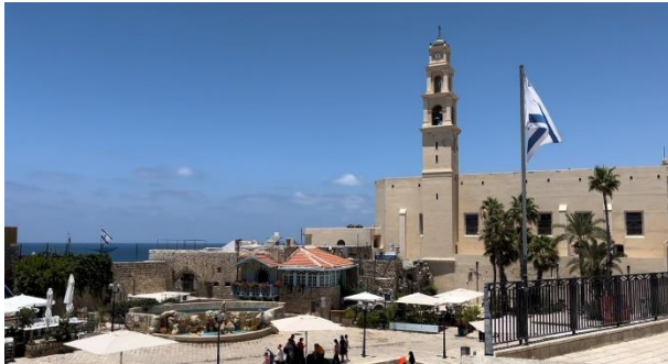
In Jaffo kreeg Petrus het bekende visioen van de reine en onreine dieren.

Weet je dat het huis van Simon de Leerlooier een erg belangrijke plaats is; vooral ook voor niet-Joden? Op het dak van het huis ontvangt Petrus een visioen (Hand. 10:1-11:18). Het is het bekende visioen over reine en onreine dieren. De boodschap van het visioen is dat Petrus iets wat God gereinigt heeft, niet als onheilig mag zien.