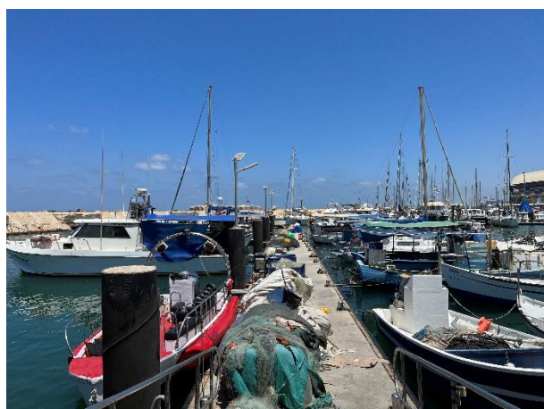
Ook in de tijd van de Bijbel was Jaffo al een havenstad.

Ook in de tijd van de Bijbel was Jaffo al een haven. In Jaffo pakte Jona, ongehoorzaam aan zijn roeping van God een schip naar Tarsis (Jona 1:3).