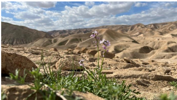
Als je goed kijkt zie je in de woestijn soms opeens prachtige bloemen.

De langste tijd van het jaar is de woestijn ontzettend dor en droog. Als je in het voorjaar echter goed kijkt, zie je tussen de rotsen en stenen soms opeens prachtige bloemen bloeien. Vaak moet ik dan denken aan de woorden van de profeet Jesaja. Hij profeteert dat de woestijn eens zal bloeien als een roos (Jes. 35:1-2).