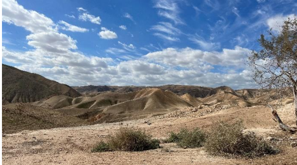
De Woestijn van Judea.

Veel mensen denken bij een woestijn aan een grote zandbak. Maar weet je dat er heel veel verschillende woestijnen zijn? Zo is de Woestijn van Judea een rotswoestijn. In Israël noemt men zo'n woestijn een 'midbar', een 'wildernis'. Het is een gebied vol bergen, kloven en rotsen.