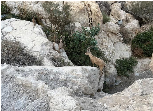
Het is verbazend hoeveel dieren er in de woestijn leven.

De woestijn lijkt een verlaten gebied. Het is echter verbazend hoeveel dieren er toch nog leven, en dan vooral ook in de buurt van oasen. Denk aan: steenbokken, hyena's, wolven, woestijnvossen, klipdassen. En dan heb je natuurlijk ook nog slangen, schorpioenen.