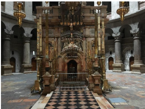
De belangrijkste plek van de Grafkerk is de Grafkapel.

De belangrijkste plek van de Grafkerk is de Grafkapel. De kapel staat in het midden van een grote koepel. De kapel is gebouwd op de plek waar, naar verluidt, de Heere Jezus zou zijn begraven. Toen was het uiteraard nog gewoon een tuin, met daarin een nieuw rotsgraf.