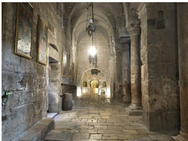
De Grafkerk is eeuwenoud. De eerste kerk op deze plaats is ingewijd in het jaar 335.

De Grafkerk (in het Engels: 'Church of the Holy Sepulchre') is een heel bijzondere plaats. Veel deskundigen zeggen dat deze grote kerk is gebouwd op de plek waar de Heere Jezus is gestorven en begraven. Beide plaatsen, Golgotha en het graf van de Heere Jezus, zijn te bezichtigen.