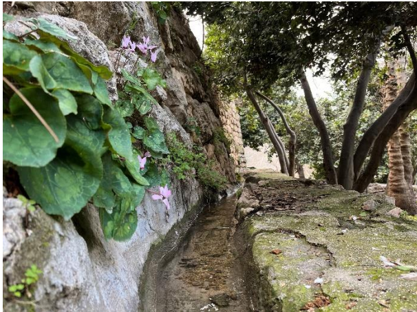
Het water uit de cistern wordt via kanaaltjes naar de akkers geleid.

Wat opvalt is dat de waterkwaliteit uit de waterbak lang niet zo goed is als het water dat rechtstreeks uit de bron komt. Hiernaar verwijst ook de profeet Jeremia.