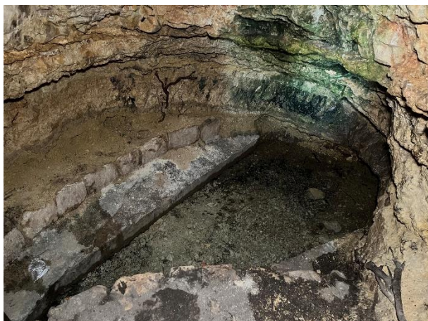
De 'ein' bij Sataf

Het water uit de bron is uiteindelijk ook gewoon regenwater. In de winter kan het in