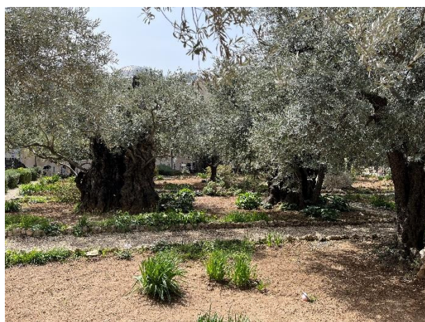
Eeuwenoude olijfbomen in de hof van Gethsémané.

Ook in het huidige Gethsémané staan olijfbomen. Het zijn enkele van de oudste olijfbomen in Israël. Vroeger werd gedacht dat deze bomen stammen uit de tijd van de Heere Jezus. Dat blijkt niet waar te zijn. Bomenkenners schatten dat de olijfbomen ongeveer 900 jaar oud zijn.