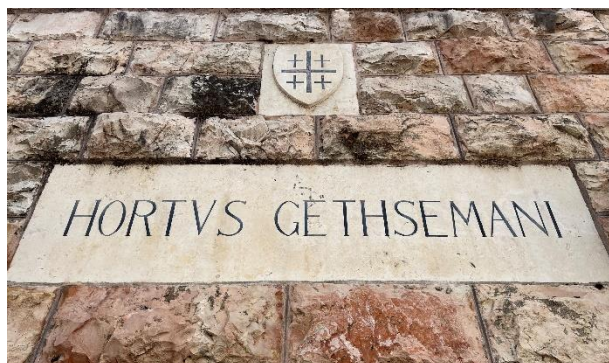
Tegenwoordig is Gethsémané een ommuurde hof.

Tegenwoordig is Gethsémané een ommuurde hof. De plek wordt al in de vierde eeuw genoemd wordt. De hof heeft dus op z'n minste hele oude papieren.