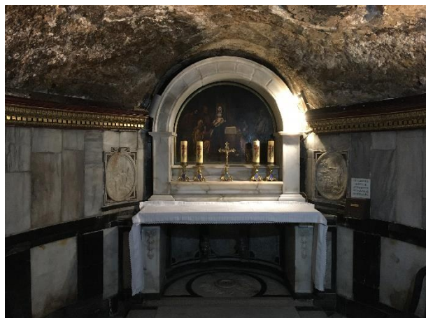
'Dit is de plaats waar de voorloper van de Heere geboren is', staat er in het Latijn.

De St. Johanneskerk is gebouwd op de plek waar, zo wordt gezegd, vroeger het huis stond van Zacharias en Elizabeth. Dat is natuurlijk niet zeker. Al vele eeuwen wordt het echter van deze plaats gezegd.