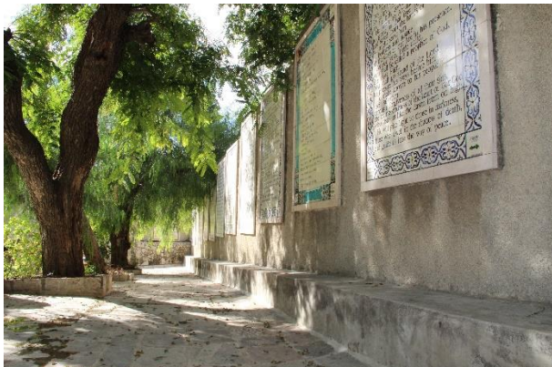
Op een lange muur bij de St. Johanneskerk is de lofzang van Zacharias weergegeven in een heleboel talen.

In Ein Kerem en omgeving staan talloze kerken en kloosters. Het zijn vaak prachtige gebouwen. Daar gaat het ten diepste echter niet om. Belangrijker is dat je onthoudt wat een wonder het is dat de Heere na ongeveer 400 jaar weer ging spreken.